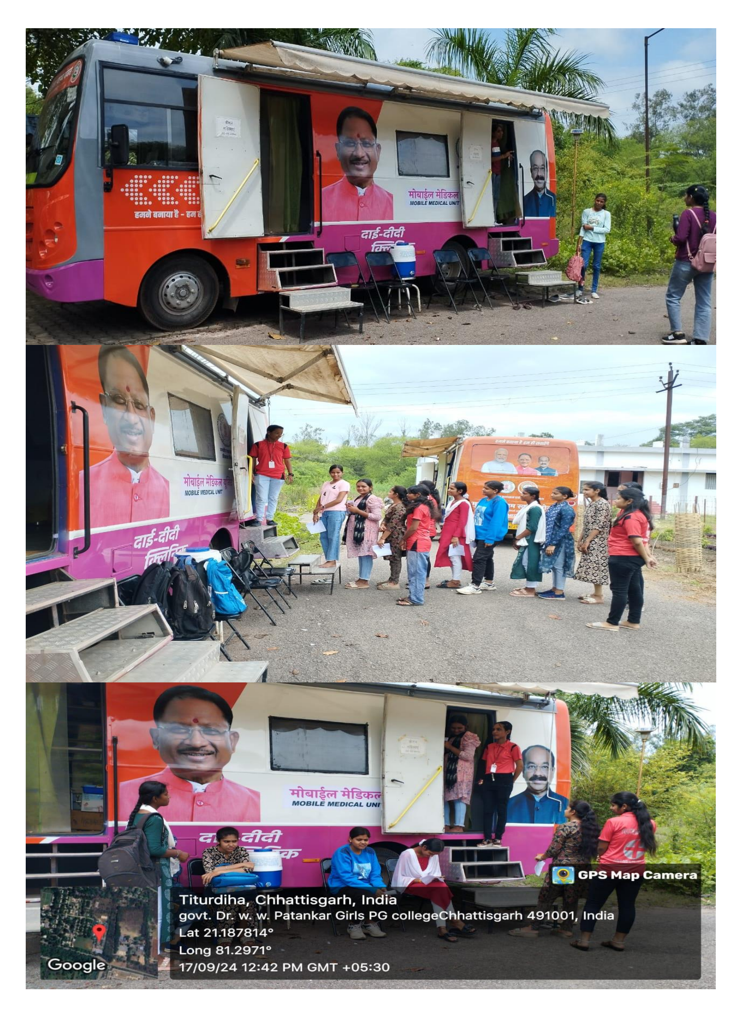
Mukhyamantri Mobile Medical Unit Facility