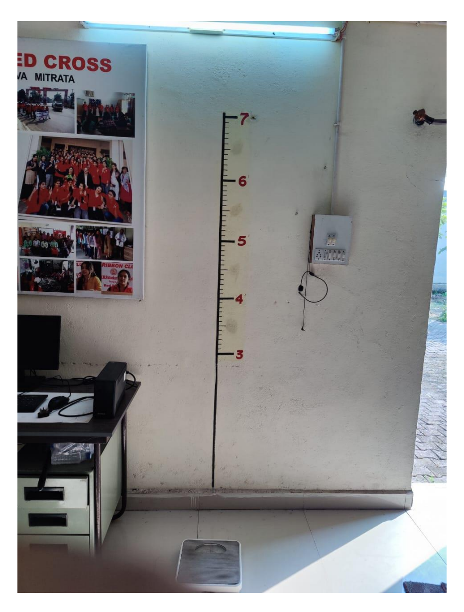
Height & Weight Measurement Facility