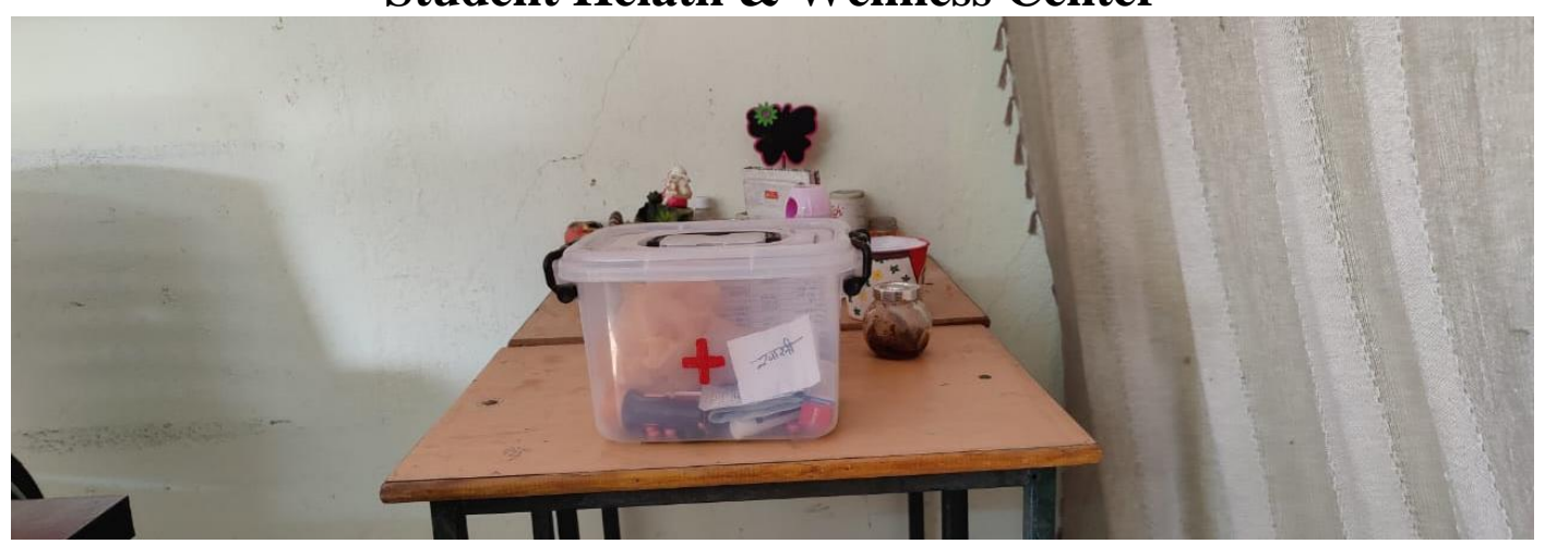
First Aid Facilities